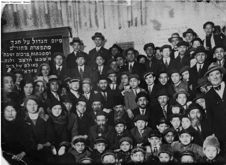
הנהלת תפארת בחורים, וילנה 1932.

שהגיע לביקור ונועץ עם הרב גרוז'נסקי במטרה לסייע להן. 106 העיתון הפציר בקוראיו לתרום למען יהודי רוסיה ולהתפלל עבורם, ודיווח על תרומות של יהודים אורתודוקסים בארצות הברית וועד הישיבות. 107