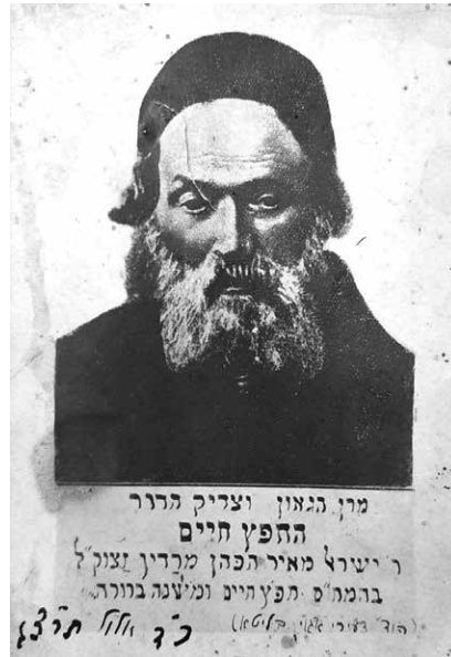
החפץ חיים.

פעולה בעניין זה גם עם ראשי הציבור הציוני והציוני־דתי. 35 במקביל עודדו הרבנים את התרומות לוועד הישיבות וכך הפציר הרב גרוז'נסקי בקוראי העיתון: