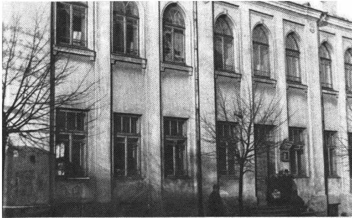
ישיבת רמזילס.

ברדיפתם של כ־80,000 יהודי העיר. עוד לפני הכנסתם לגטו נרצחו כ־35,000 יהודים בפונאר. בינואר 1942 הקימו היהודים ארגון פרטיזני ובספטמבר 1943 החלו הגרמנים בתהליך חיסול גטו וילנה. כ־100,000 יהודים מווילנה ומהסביבה נספו בשואה.