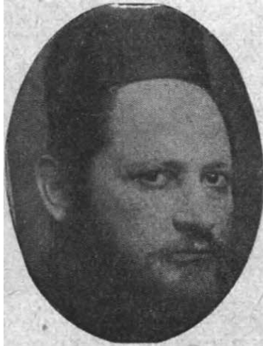
הרב יצחק רובינשטיין.

בהשתתפות נשים וכוונתם לכבוש את הקהילות תחת ידם [...] ולדעתי כי מי אשר יראת ד' נגע בלבו אסור להתחבר ולהיעד אתם". 49