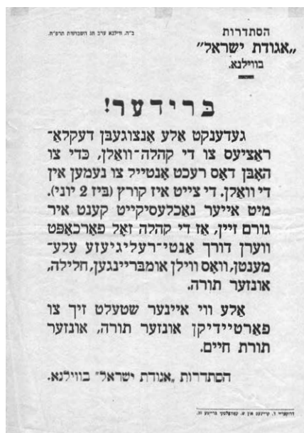
כרוז בחירות אגודת ישראל בוילנה, 1928.